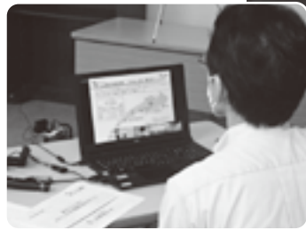
Webによる総対話活動の様子2