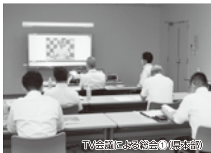
TV会議による総会①(県本部)