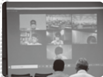
Webによる総対話活動の様子3