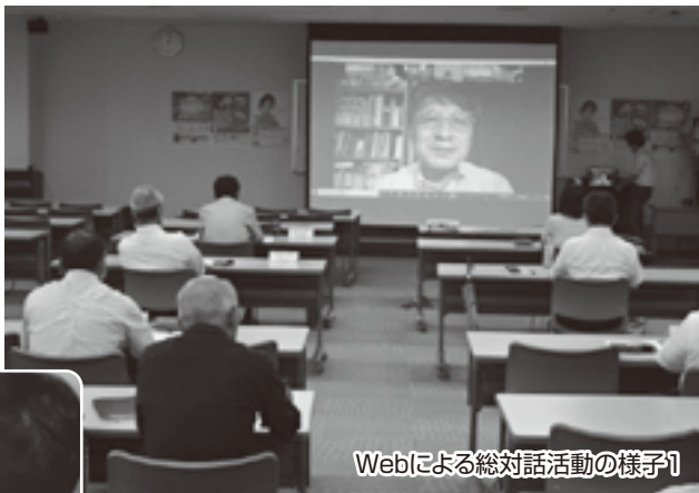
Webによる総対話活動の様子1