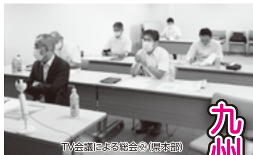
TV会議による総会②(県本部)