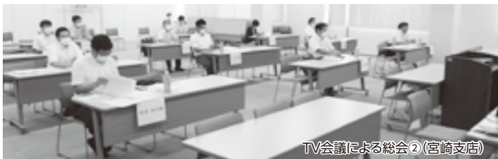
TV会議による総会②(宮崎支店)