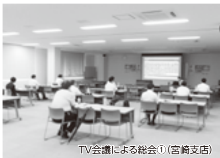
TV会議による総会①(宮崎支店)

2020年度は、「第6期中期経営計画」の最終年度として、中期経営計画で掲げる目標を達成するとともに、第7期中期経営計画につなげるため、会員の皆さまのご理解・ご協力をいただきます。ながら各施策を展開してまいります。