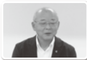
退任された下原前理事(宮崎県教職員組合)

最後、「ひとりでは万人のために、万人はひとりのために」のスローガンのもと、労働者福祉運動に係るすべての方々が一緒になって運動の推進・発展に頑張っていくことをこの場で誓い合いました。