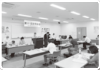
第61回通常総会の様子

最後、「ひとりでは万人のために、万人はひとりのために」のスローガンのもと、労働者福祉運動に係るすべての方々が一緒になって運動の推進・発展に頑張っていくことをこの場で誓い合いました。