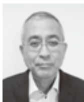
福島宮崎県本部長