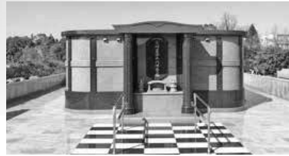
永代供養墓 (合葬墓)

永代供養墓には、骨壺を安置する合葬墓と、粉骨したご遺骨を合祀し、供養する合祀堂があります。また、正面には、お参りのための香炉、花立て等が設置されています。側面には墓碑銘プレートを設置する銘碑が設けられています。